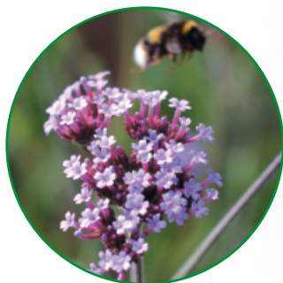
Bei Mensch und Tier ist Eisenkraut sehr beliebt.