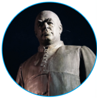
Seit 200 Jahren wird erfolgreich die Philosophie von Sebastian Kneipp angewendet.