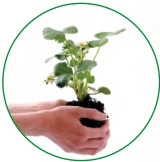
Bis Ende September sollte die Erdbeere im Garten gepflanzt sein

Tipps und wissenswertes über die beliebte Sommerfrucht